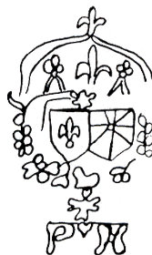
Dessin réalisé par Pierre Delaunay, "Le papier du manuscrit des Pensées de Blaise Pascal", Bulletin de la librairie ancienne et moderne , n° 150, décembre 1972.

Des marques présentes sur les papiers 49-8, 137-2 et 411-3 confirment une partie de la reconstitution. Mais ce type de reconstitution est très difficile à vérifier sur un tel filigrane (voir ci-dessous). Les photos que nous avons pu prendre des fragments du filigrane sur les papiers 49-8 (couronne surmontée d'une fleur de lys) et 123-2 (partie inférieure avec les lettres P ♥ H) confirment la provenance de ces fragments de filigrane mais n'assurent pas qu'ils proviennent d'un même feuillet. Quant au papier 467-1, la photo du fragment confirme un fragment de filigrane dans la moitié droite du papier, qui n'est pas incompatible avec le reste du filigrane. La reconstitution complète de Pol Ernst a de grandes chances d'être correcte bien qu'elle s'appuie sur des éléments fragiles. Voir cette reconstitution.